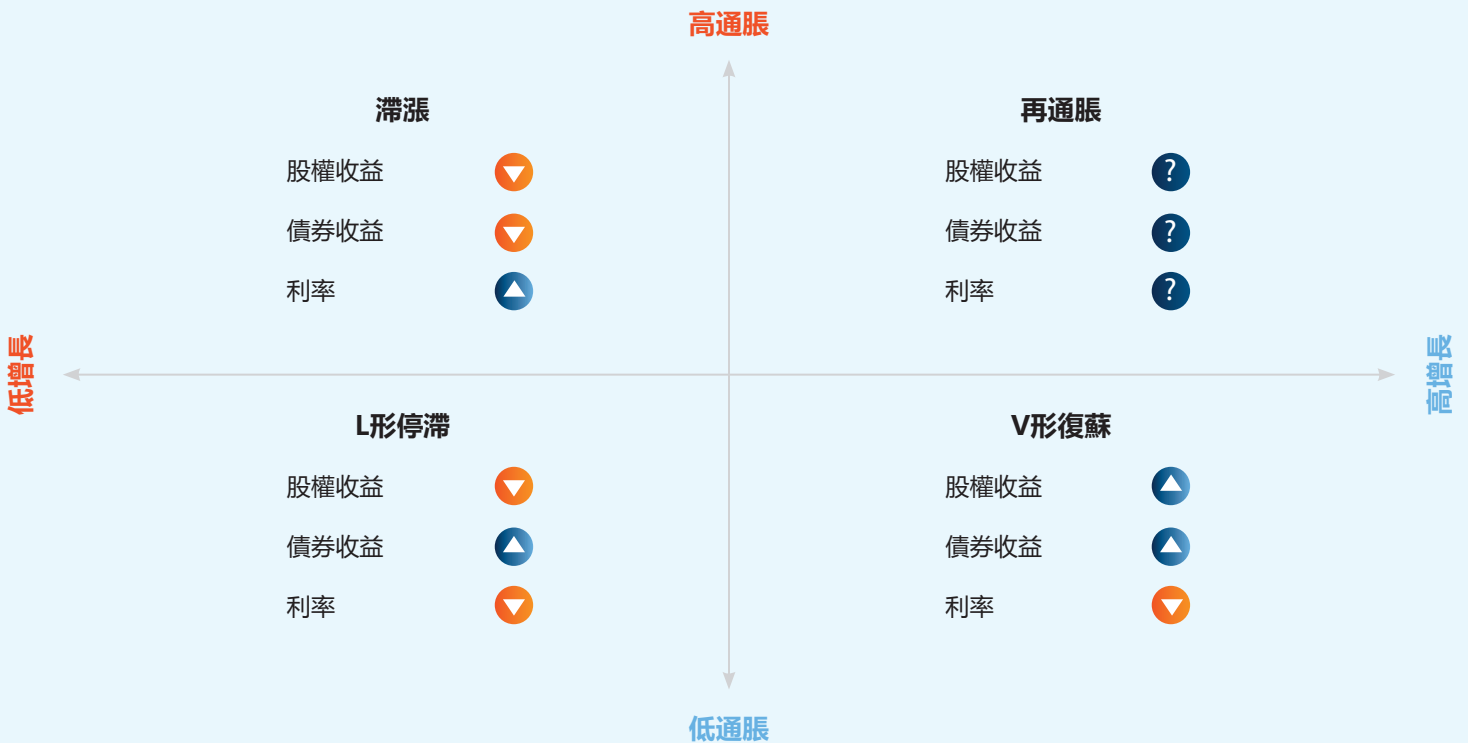
圖2. 資產類別在不同經濟環境中的預期敏感度

儘管短期前景取決於與疫情相關的各種不確定性，投資者們也十分關注中期經濟前景及其對金融市場的影響。資產類別一般會以可預見的方式對經濟狀況相對於市場預期的變化做出回應。經濟增長中的意外之喜往往會帶來股權、企業信貸和新興市場的上揚。通脹上升一般會對通脹掛鉤債券、黃金和大宗商品產生積極影響。圖2總結了各個資產類別在不同經濟狀況或體制中的預期表現。